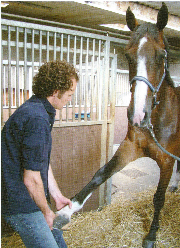
Een eenvoudige techniek, zoals deze voorwaartse stretch van het voorbeen, heeft een effect op een verrassend groot aantal spieren, zelfs tot aan het bekken.