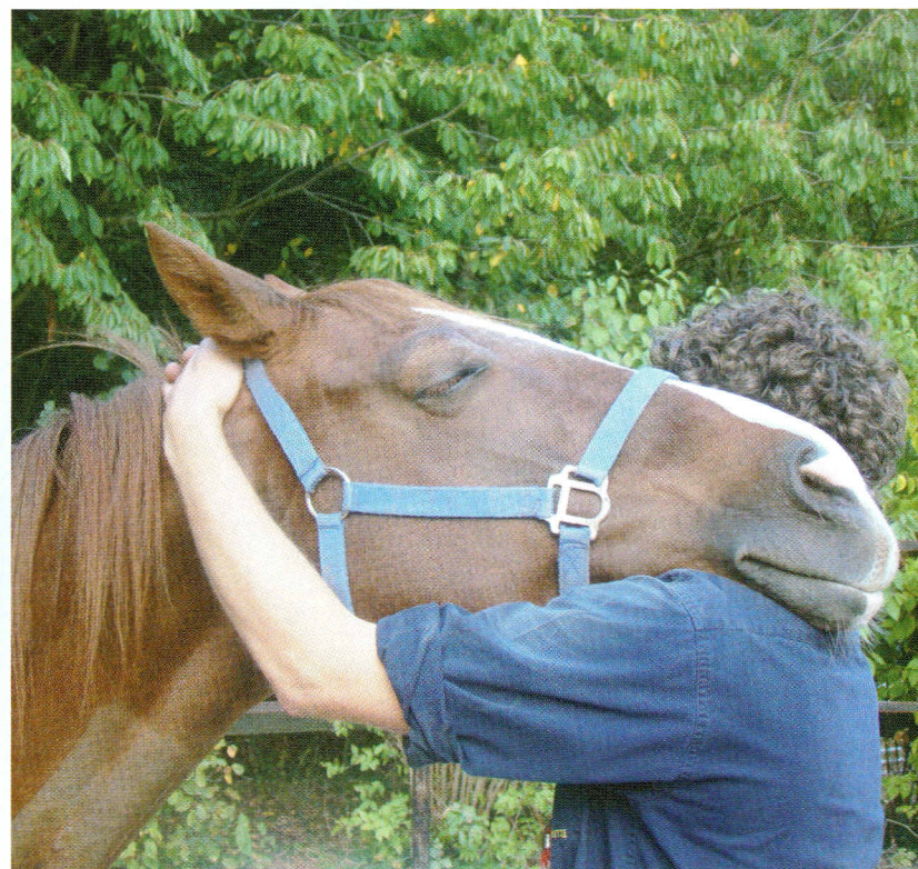
Het ene (de orthosympaticus) stimuleert, terwijl het andere (de parasympaticus) afremt en kalmeert.

galopwissels, moeilijk onderbrengen van de achterhand.