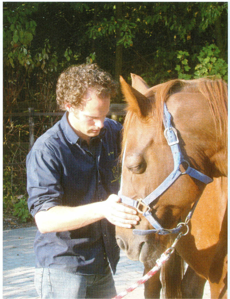
De gebruikte technieken zijn pijnloos. Het effect van een manipulatie wordt verwezenlijkt door een combinatie van snelheid en een lange hefboom. Er komt geen kracht bij kijken.

De osteopathische geneeskunde is gebaseerd op enkele belangrijke principes.