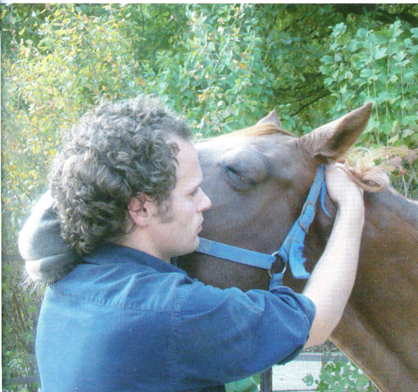
Bij een blokkade heeft de orthosympaticus de overhand (spieren zijn gespannen en pijnlijk).