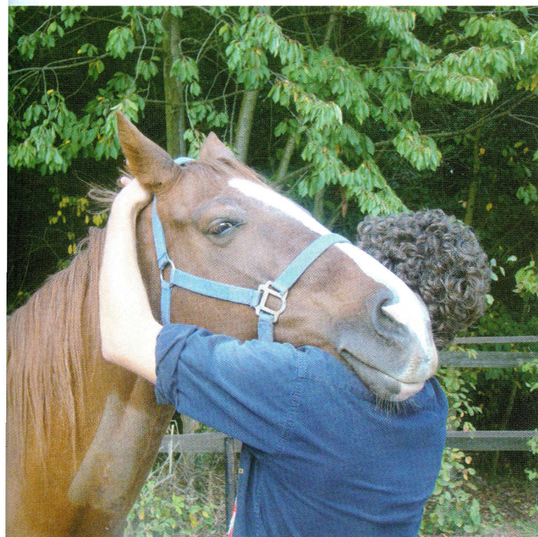
In ons lichaam wordt alles neurologisch geregeld door twee tegengestelde systemen.